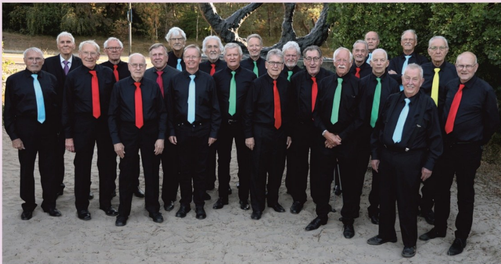
ontwerp: big jim productions

Je bent welkom! Woon gratis en vrijblijvend enkele repetities bij om de muzikale en sociale sfeer te proeven. Bel 073-521 47 68 (Jim v Brakel) en we zetten een stoel voor je klaar. www.rosmalensmannenkoor.nl